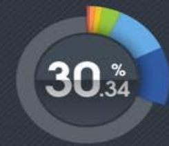
パートナーシップ制度 導入自治体人口割合